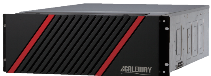
SCALEWAY SG1000 (4U)

(주)넷클립스는 스토리지 솔루션 전문회사로 끊임없는 노력과 최상의 서비스를 제공합니다. SCALEWAY는 (주)넷클립스의 등록상표입니다.