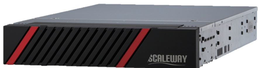
SCALEWAY SG3500 (2U)

(주)넷클립스는 스토리지 솔루션 전문회사로 끊임없는 노력과 최상의 서비스를 제공합니다. SCALEWAY는 (주)넷클립스의 등록상표입니다.